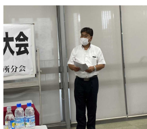
前田分会長 怒りの挨拶！